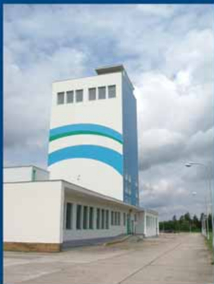
Zateplení budovy dávkování č. 1