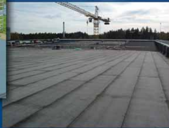
Rekonstrukce střechy budovy filtrace 2