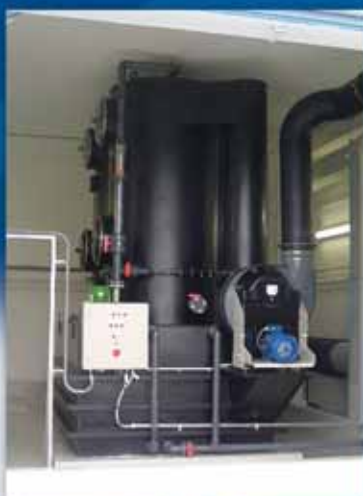
Rekonstrukce neutralizační stanice chlóru vodojemu Jesenice