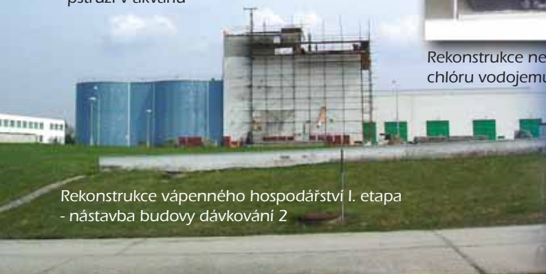
Rekonstrukce vápenného hospodářství I. etapa - nástavba budovy dávkování 2