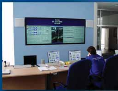
Rekonstrukce velína – nové velkoplošné zobrazení