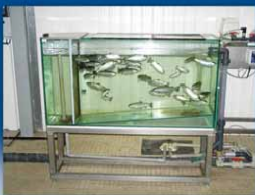
Kontrola nezávadnosti upravené vody – pstruzi v akváriu