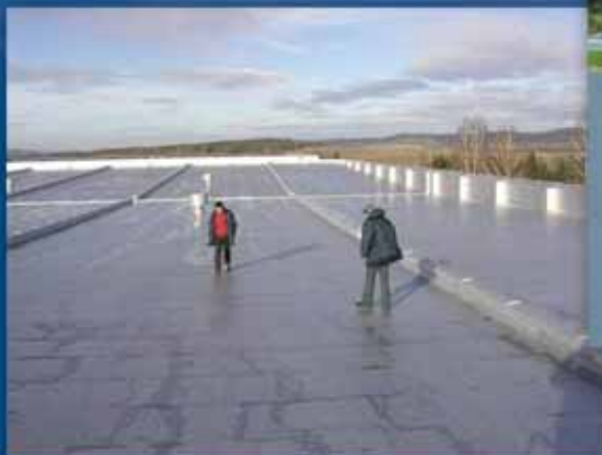
Kontrola opravy nátěru střechy budovy filtrace 1