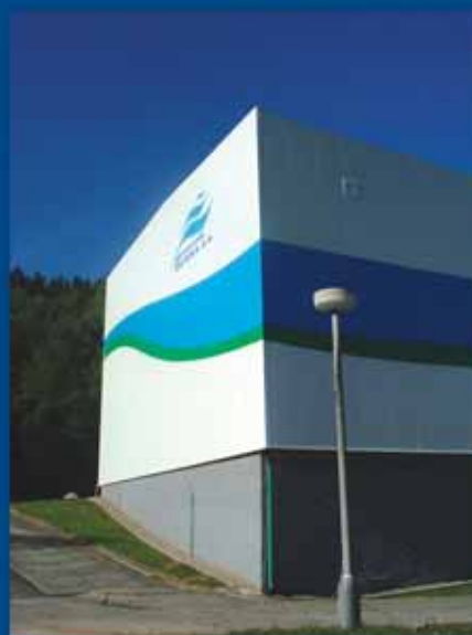
Zateplení čerpací stanice surové vody